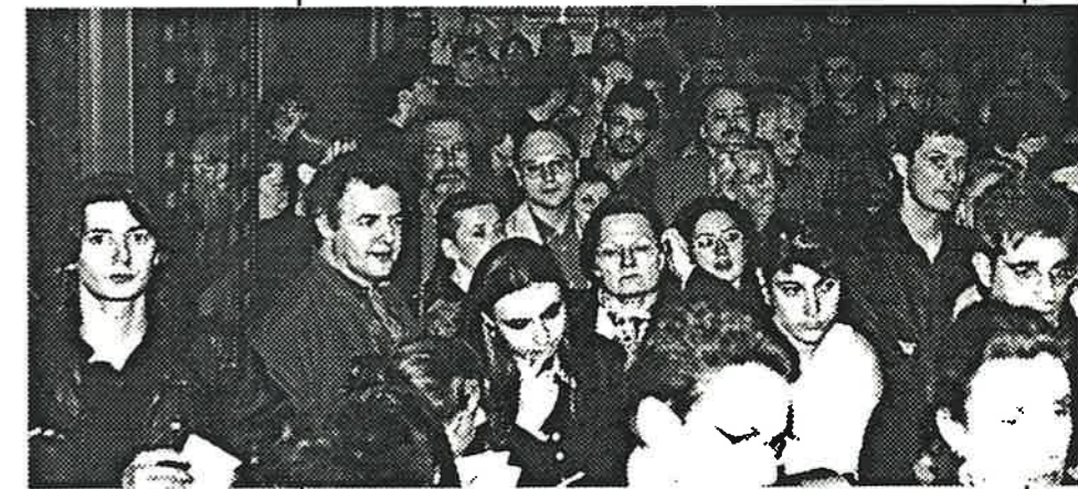
La foule des grands jours était au rendez-vous pour la conférence de presse parisienne de la Semaine, à l'Espace Saint Michel, le 15 avril dernier (voir le programme complet en dernière page)

La Semaine de la critique, née de la nécessité d'un coupe feu à une certaine dérive commercialisante du festival, se devait aussi à plus ou moins long terme, par fidélité à sa vocation, de rectifier le tir et de rappeler que la notion de découverte réside également dans un intérêt soutenu pour... disons les durées non normatives. J'en fis la proposition, certes timide, en 1978 ou 79. Objection commune: il n'est pas question de saturer de centaines de courts un comité de sélection déjà fort affairé avec autant de longs. Et comme il n'est pas question non plus de déroger à la tradition de collégialité du comité, retour à la case départ. Même si avait été admis le principe d'une tête chercheuse, qui allait en accepter la charge?