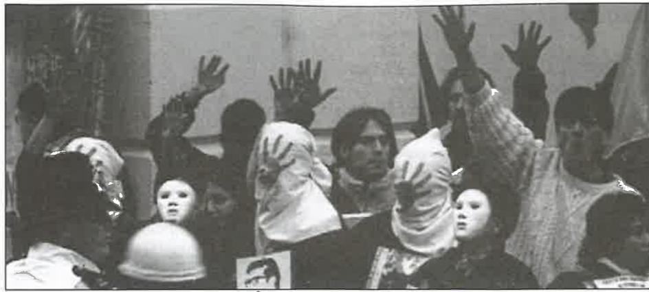
Le Cas Pinochet, de Patricio Guzman