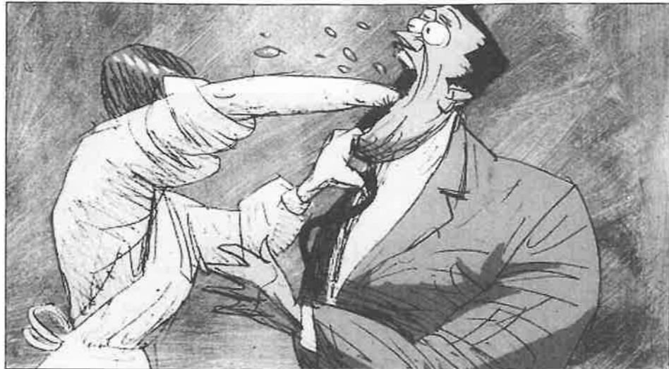
Eat, de Bill Plympton