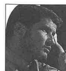
Ziré Nouré Mâh, de Reza Mir-Karimi

Une circulaire concernant les autres festivals a été adressée à tous les membres du Syndicat