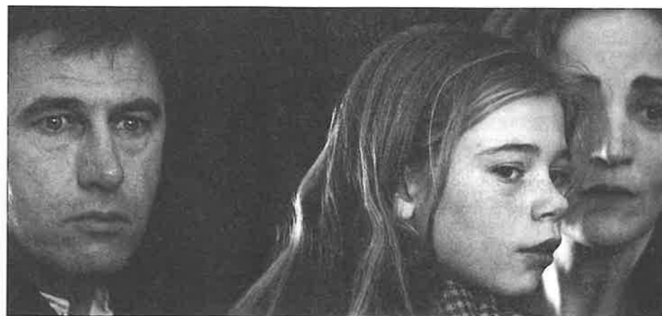
La Plage noire, de Michel Piccoli

La Plage noire, de Michel Piccoli, (France) deuxième film de l'acteur le plus aimé du cinéma français a ouvert le feu. Le film creuse, par son mystère, ce qui passionne l'homme, le militant et le réalisateur Piccoli : le refus de la dictature.