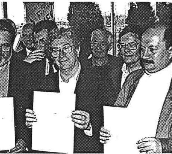
Remise des Prix de la Critique Internationale (FIPRESCI) au club Piper-Heidsieck de Cannes

Marly-le-Roi, Namur... Pas si petits que ça, du reste, et comportant nombre de compensations non négligeables. Passons sur Venise, où j'ai été un jour parachuté, et où j'ai passé le plus clair de mon temps à courir après des confrères qui n'avaient qu'une hâte, prendre le premier vaporetto pour aller musarder dans la Cité des Doges... Passons sur Montréal, qui fut, grâce à mon ami le regretté Roger Lemelin, une grande aventure. Tenons-nous-en à Cannes où, en 1989, j'eus l'insigne honneur de faire partie du «grand jury», et cette année, du jury de la Presse