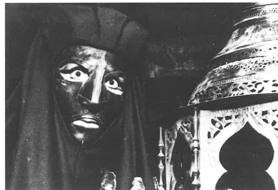
Belphégor, la série mythique de Claude Barma.

Pour certaines productions fictionnelles cependant (surtout les séries à héros récurrents) des contraintes spéciales, un formatage particulier, des bibles concernant notamment les personnages et les situations s'imposent aux différents réalisateurs et scénaristes appelés à intervenir sur ces séries. Le regard critique est ici nécessairement différent de celui porté à la fiction unitaire.