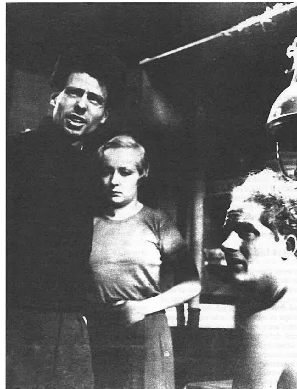
Tournage de l'Atalante aux Studios des Butte-Chaumont, Jean Vigo avec Dita Parlo, et Jean Dasté.

L'Ecran intérieur , Cinergon n° 12. Flashback sur la Nouvelle Vague , CinémaAction n° 104, 3ème trimestre 2002. Hitchcock, Lang , Trafic n° 41, printemps 2002. Islam, croyance et négritude dans les cinémas d'Afrique , Africultures n° 47.