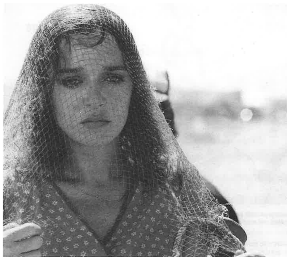
Respiro de Emanuele Crialese, Grand prix du long métrage de la SIC 2002

Pour la première fois, France 3 national a fait un sujet très complet sur "BELLA CIAO" en invitant le producteur Carlo Freccero et en le diffusant nationalement. Philippe Lefait a traité de la