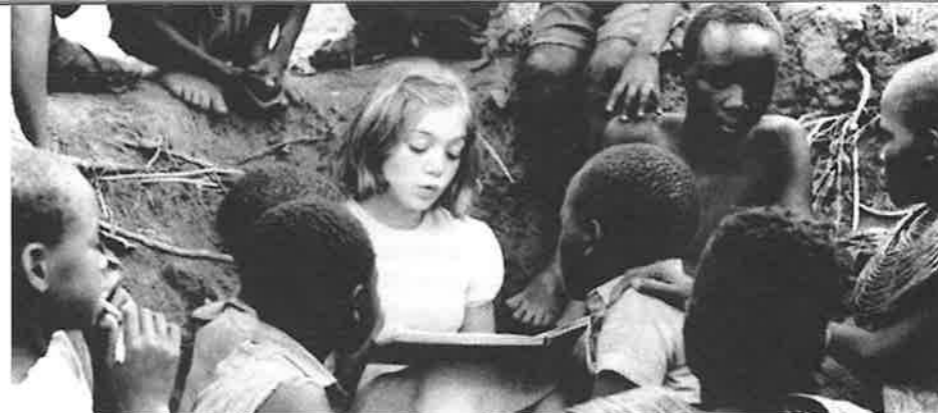
Nirgendwo in Afrika (Nowhere in Africa) de l'Allemande Caroline Link

Les maillings postaux sont de plus en plus coûteux. Aussi essayons de regrouper nos envois. Cependant pour l'envoi d'informations du type candidatures aux jurys Fipresci nous avons décidé, devant le nombre de plus en plus important d'adhérents possédant une adresse e. mail, de faire ces envois d'informations syndicales en courrier électronique. Seuls ceux n'ayant pas ce type d'adresse continueront à recevoir des courriers par la poste. Nous demandons par contre à ceux qui jusqu'à maintenant ne nous avaient pas communiqué leur adresse électronique de le faire le plus rapidement en nous l'envoyant à critique@club-internet.fr . Ainsi votre Syndicat pourra faire de sérieuses économies et nous donnera d'autres possibilités d'action. Merci d'avance.