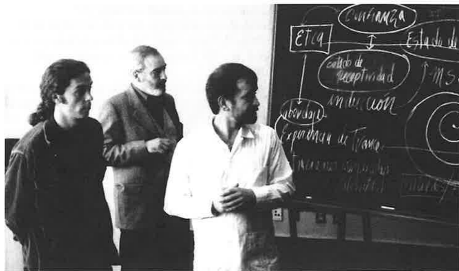
Prix du court métrage de la SIC 2002, De Mesmer, con amor o Té para dos , de Salvador Aguirre et Alejandro Lubezki (Mexique)

diennes dans REPPUBLICA, CORRIERE DELLA SERA exceptionnelle avec des manchettes telles que "BELLA CIAO ENFLAMME LA CROISSETTE". "Le MONDE" a fait un papier bilan du cinéma italien "qui renoue avec l'engagement socio-politique" sous la signature de J. Mandelbaum et J-F. Rauger