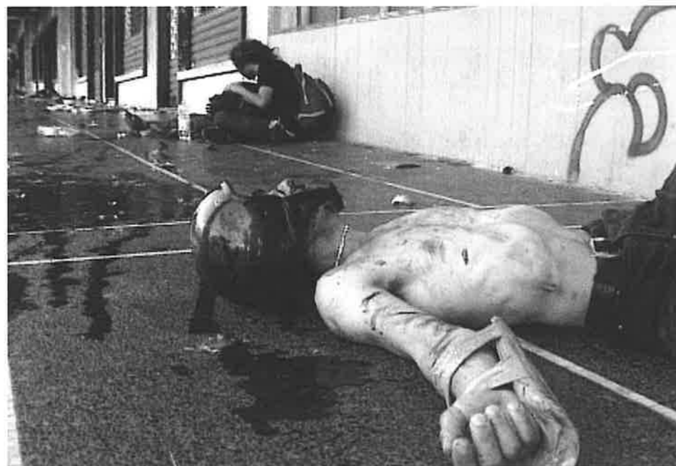
Bella Ciao, de Marco Giusti et Roberto Torelli. Un documentaire implacable sur les brutalités policières durant les manifestations anti mondialisation de Gênes en juillet 2001

SIC dans "Des mots de minuit", sujets : KALBALA, TOO YOUNG TO DIE et la Bande-annonce de la SIC. INTACTO a été couvert plusieurs fois par Canal + dans le "Journal du cinéma".