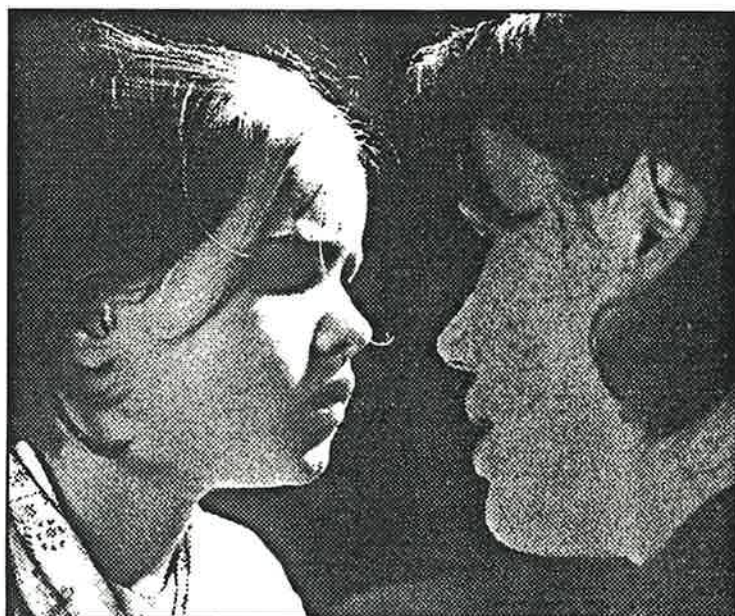
« Ponette », de Jacques Doillon, Prix de la FIPRESCI au Festival de Venise

APPELS DE CANDIDATURES URGENTS : VOIR PAGES 2 ET 12